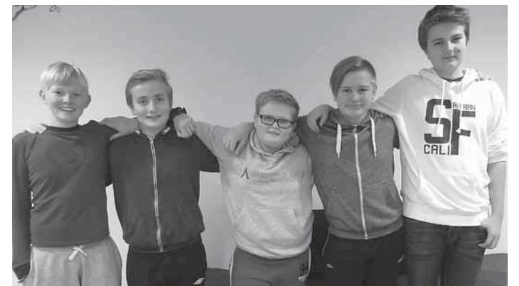
Tenestegjengen er klare for oppdrag