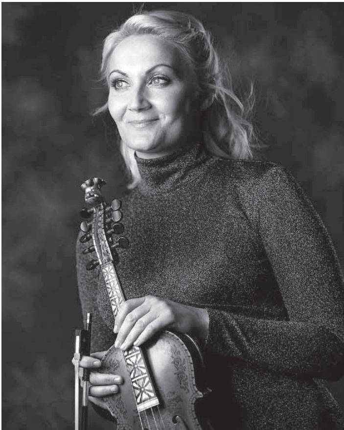
Tysdag i neste veke kjem Sigrid Moldestad til Norddal kyrkje.

Fredag 27. november kjem den folkekjære artisten Sigrid Moldestad med eit nytt album som har fått tittelen "Så ta mitt hjerte-dei beste songane". Tysdag 1. desember held ho konsert i Norddal kyrkje.